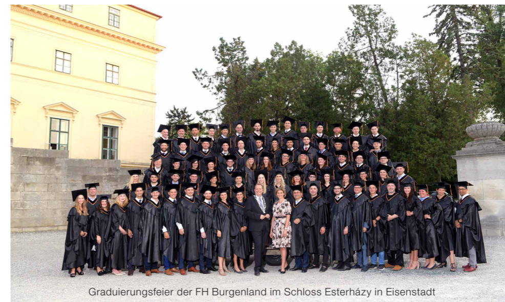
Graduierungsfeier der FH Burgenland im Schloss Esterházy in Eisenstadt

Durch Ihr gewonnenes Verständnis, lernen Sie wie eine Organisation Werte schafft, ausliefert und realisiert. Zudem erhalten Sie fundierte Kenntnisse, um Unternehmen, welche über das Internet Produkte und Services erfolgreich anbieten möchten, umfassend zu beraten und bei unternehmerischen Veränderungsprozessen zu begleiten.